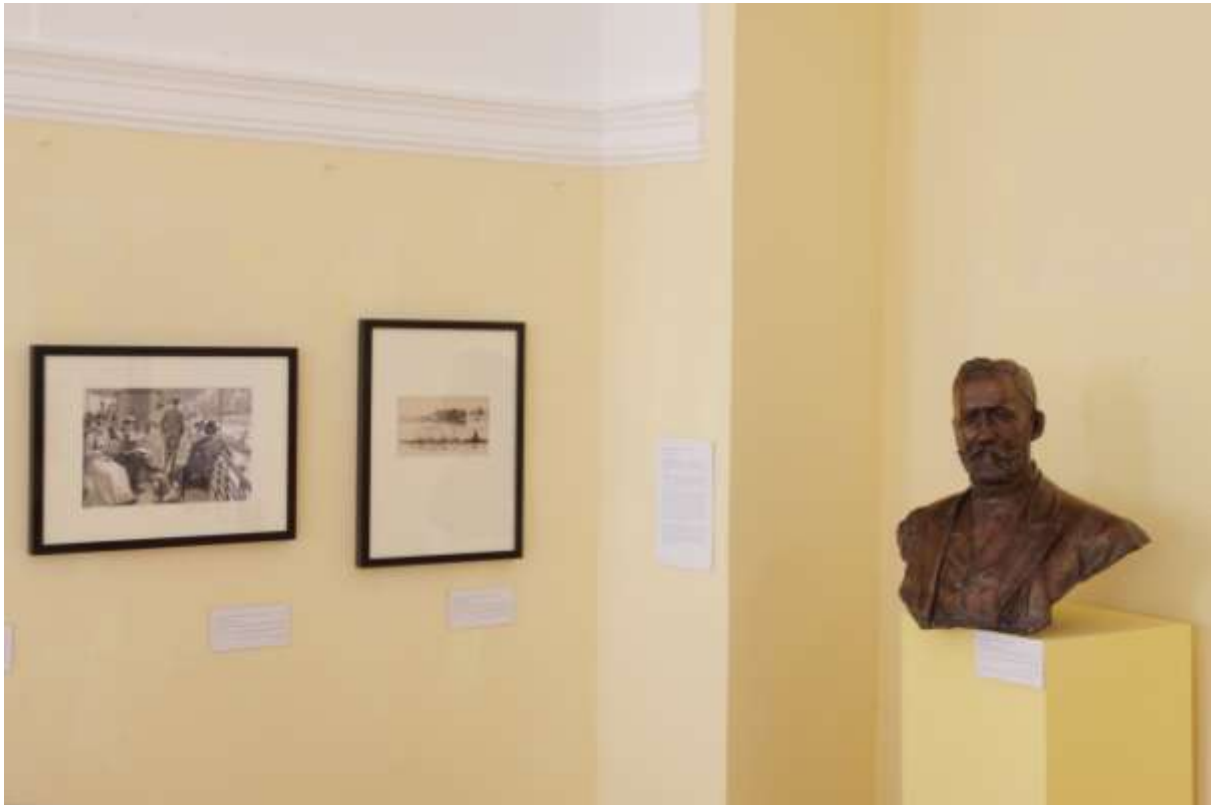
Bedő Albert mellszobra a Nemzeti Hajós Egylet 150 éves jubileumi kiállításán, 2012