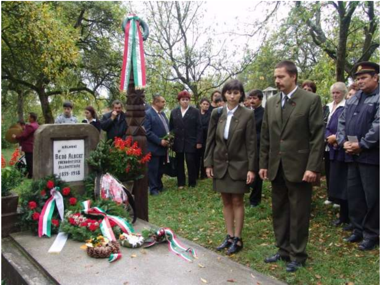
Bedő Albert sírjánál tisztelegnek az Országos Erdészeti Egyesület képviselői, 2001