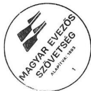
Pignitzky Borbála főtitkár