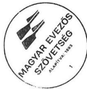
Pignitzky Borbála főtitkár